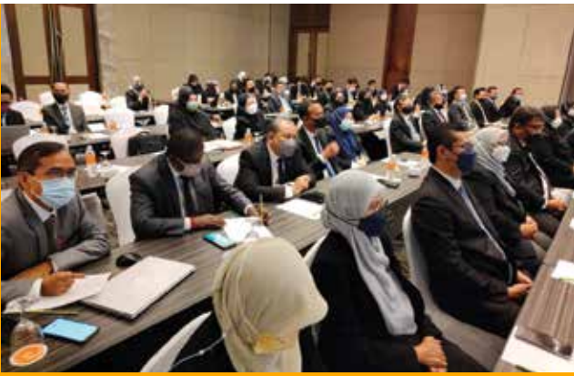
Para peserta memberikan tumpuan semasa sesi bersama Yang Arif Hakim Mahkamah Rayuan.