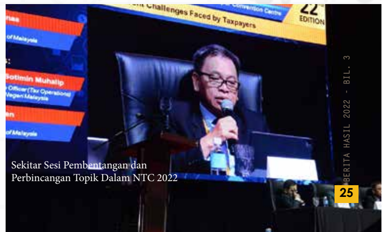
Sekitar Sesi Pembentangan dan Perbincangan Topik Dalam NTC 2022