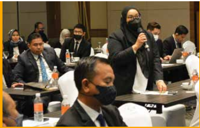
Peserta menanyakan soalan semasa sesi soal jawab Legal Convention 2022