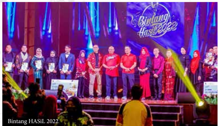
Bintang HASiL 2022

Pelbagai aksi menarik dipersembahkan dan dihidangkan kepada tetamu serta atlet Sukan HASiL 2022 Putrajaya.