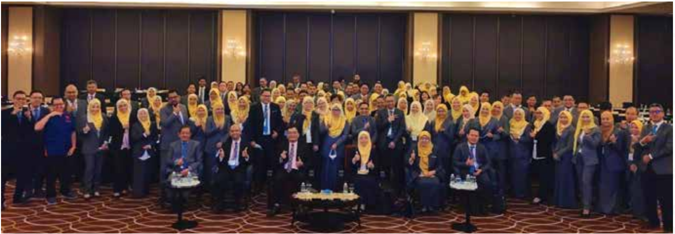
Sebahagian daripada Peserta Konvensyen Dasar Percukaian Bil.1/2022