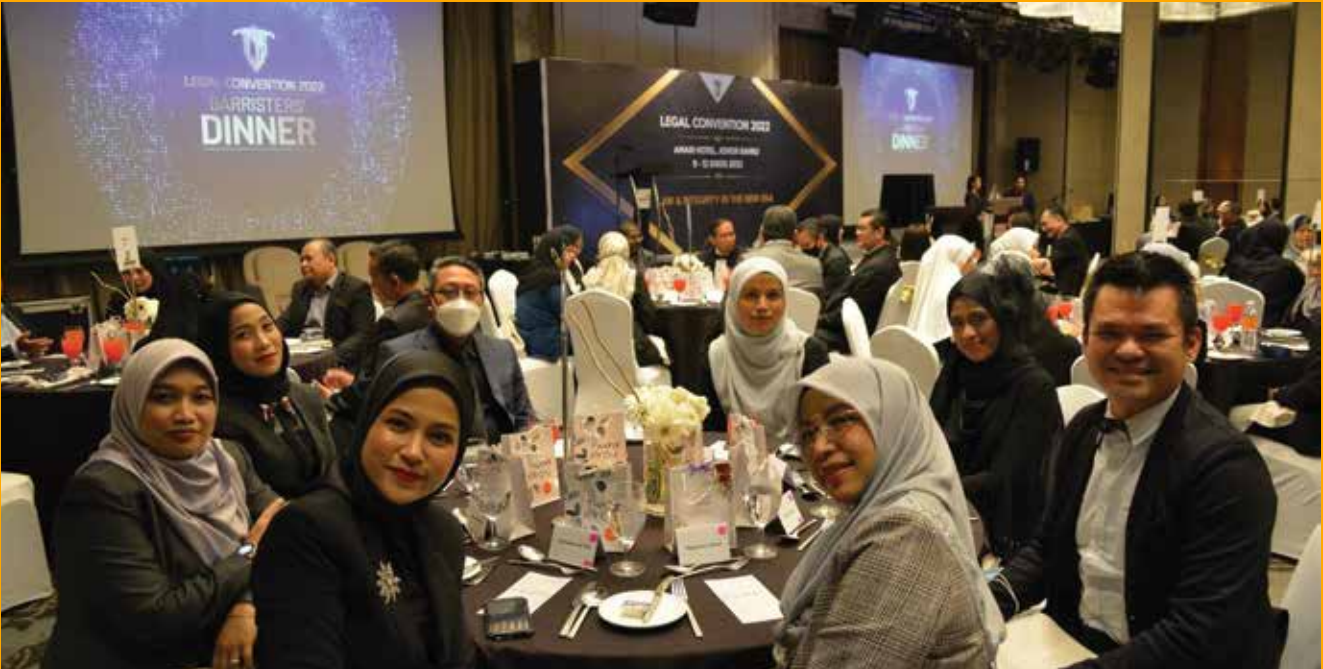
Keceriaan para peserta semasa majlis Barrister's Dinner