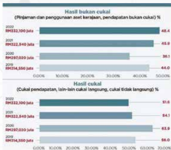
Rajah 1 : Hasil Cukai dan Bukan Cukai bagi 2019 sehingga 2022

Ini dapat dijelaskan melalui kedudukan sumber cukai dan bukan cukai dalam komponen pendapatan negara serta belanjawan negara mulai 2019 hingga 2022: