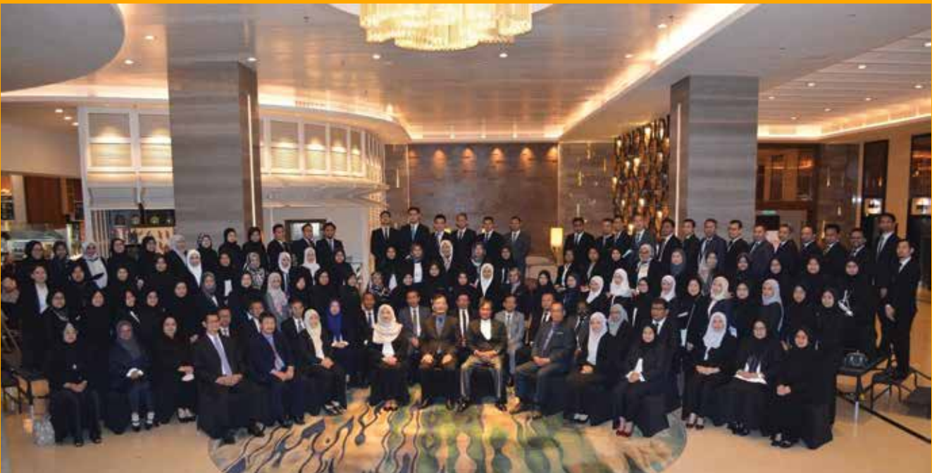
Sesi fotografi para peserta Konvensyen Undang-undang 2022.