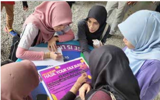
HASiL Your Tax Buddy @ UiTM Puncak Alam, Selangor pada 28 Mei 2022