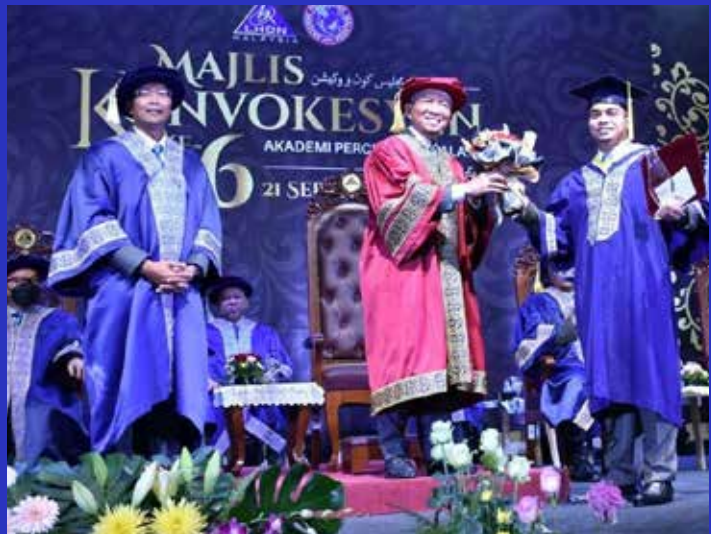
Pengurusan Tertinggi HASIL Bersama-Sama Graduan Majlis Konvokesyen Ke-6 Akademi Percukaian Malaysia