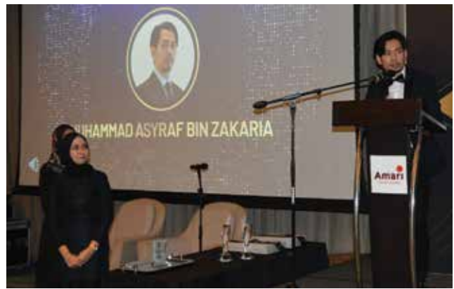
Pemenang anugerah 'Rising Star of The Year' memberi ucapan penghargaan