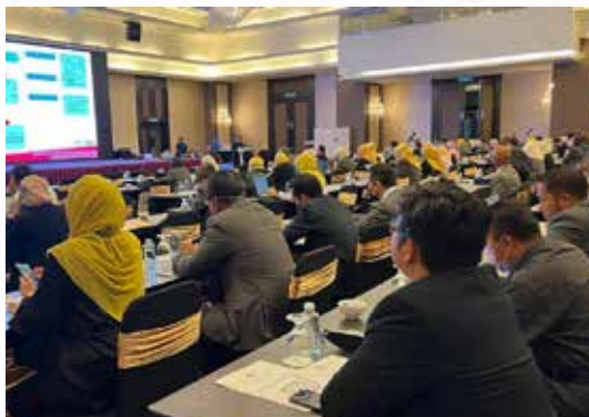
Sebahagian daripada Peserta Konvensyen Dasar Percukaian Bil.1/2022