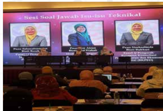
Sesi Perkongsian dan Soal Jawab Isu-Isu Teknikal yang Dikendalikan oleh Jabatan Dasar Percukaian