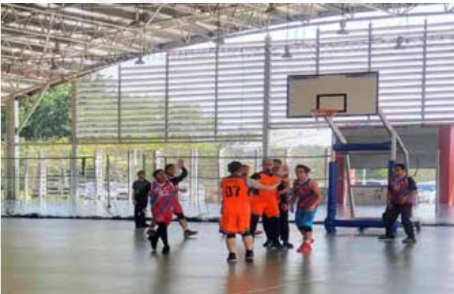
Antara Acara yang Dipertandingkan dalam Sukan HASiL 2022 Putrajaya