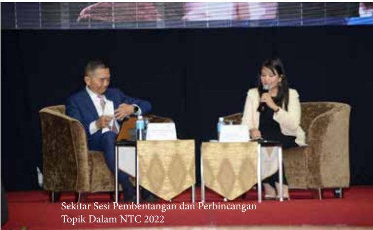
Sekitar Sesi Pembentangan dan Perbincangan Topik Dalam NTC 2022

Tema persidangan iaitu The Role of Taxation in Post Pandemic Recovery amat sesuai dan selari dengan situasi serta cabaran ekonomi yang sedang dihadapi oleh Malaysia dan seluruh dunia. Terdapat lapan (8) topik yang dibentangkan dan dibincangkan kali ini untuk tempoh dua (2) hari persidangan. Dua (2) topik yang dibincangkan adalah berkait rapat dengan impak