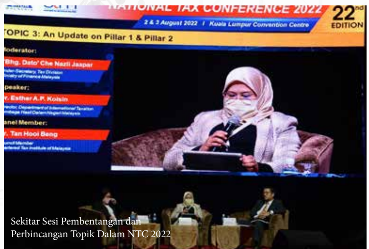
Sekitar Sesi Pembentangan dan Perbincangan Topik Dalam NTC 2022