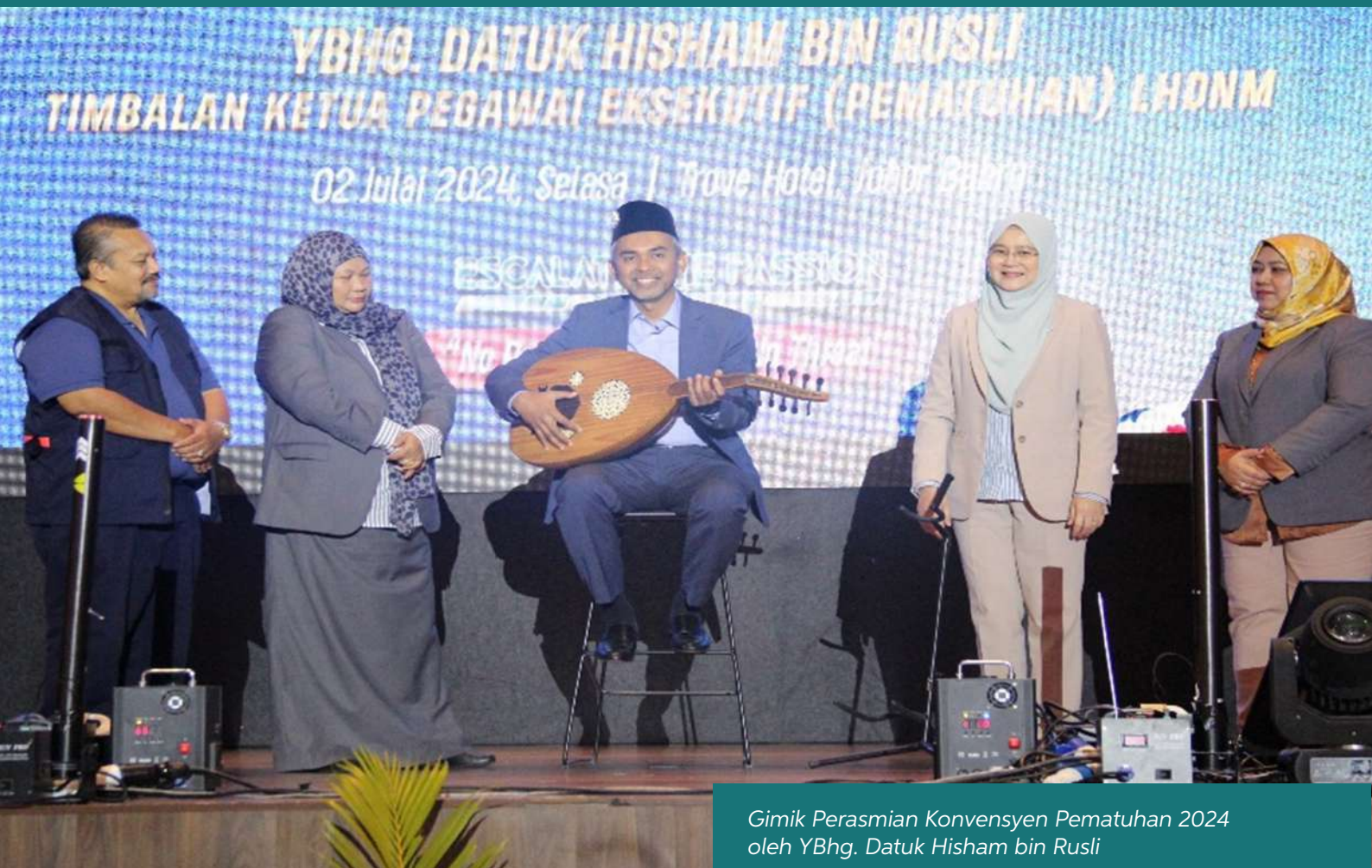
Gimik Perasmian Konvensyen Pematuhan 2024 oleh YBhg. Datuk Hisham bin Rusli

Jabatan Pematuhan Cukai (JPC) merupakan sebuah jabatan yang memainkan peranan penting dalam menyelia aktiviti audit cukai di Lembaga Hasil Dalam Negeri Malaysia (HASiL). JPC bertanggungjawab dalam merangka polisi audit cukai, perancangan pelan aktiviti audit tahunan, pemilihan kes audit dan pemantauan kualiti kerja audit termasuk aspek integriti pegawai audit.