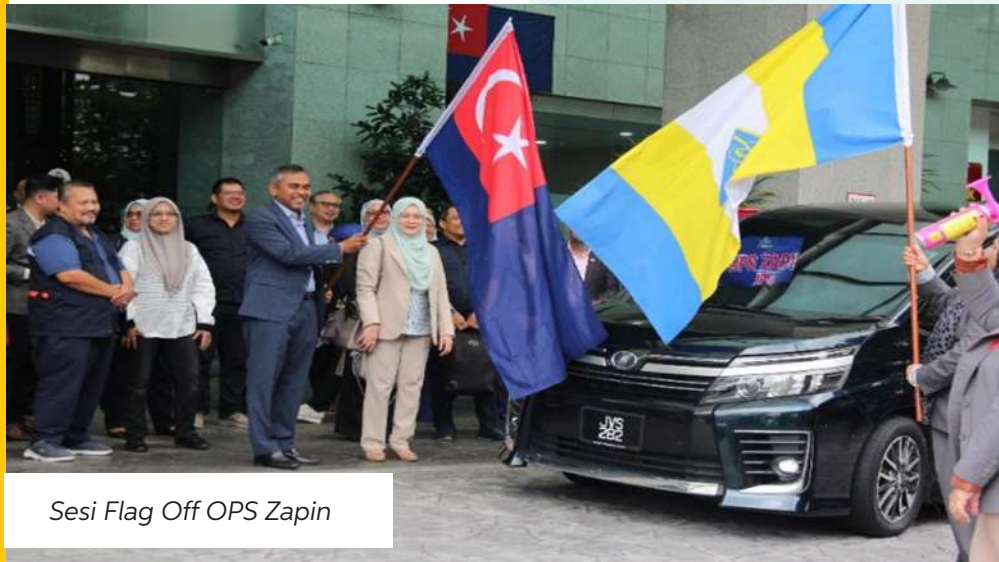
Sesi Flag Off OPS Zapin

Pelaksanaan konvensyen kali ini juga diadakan bersama dengan Ops Zapin yang melibatkan fail pembayar cukai HASiL Johor dari pelbagai industri. Sebanyak 86 fail pembayar cukai telah diaudit melibatkan 112 pegawai audit cukai HASiL Johor serta penglibatan bersama peserta konvensyen. Ops Pematuhan Cukai ini juga merupakan salah satu strategi pengurusan atasan untuk meningkatkan kesedaran cukai kepada masyarakat dan secara tidak langsung dapat meningkatkan kutipan dan kadar pematuhan.