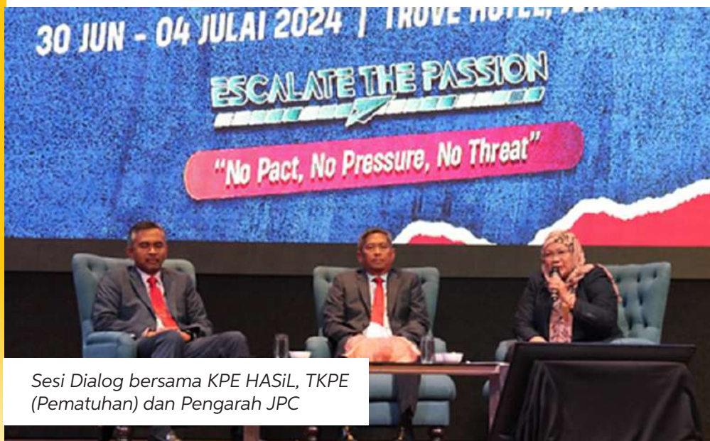
Sesi Dialog bersama KPE HASiL, TKPE (Pematuhan) dan Pengarah JPC