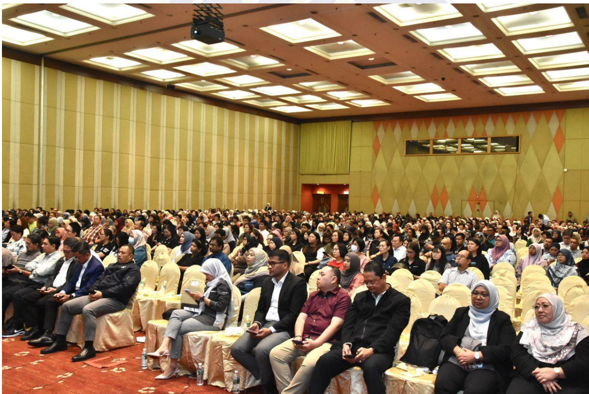
Siri jelajah seminar e-Invois peringkat negeri Johor disambut meriah dengan penyertaan seramai hampir 1,000 orang peserta hari ini.