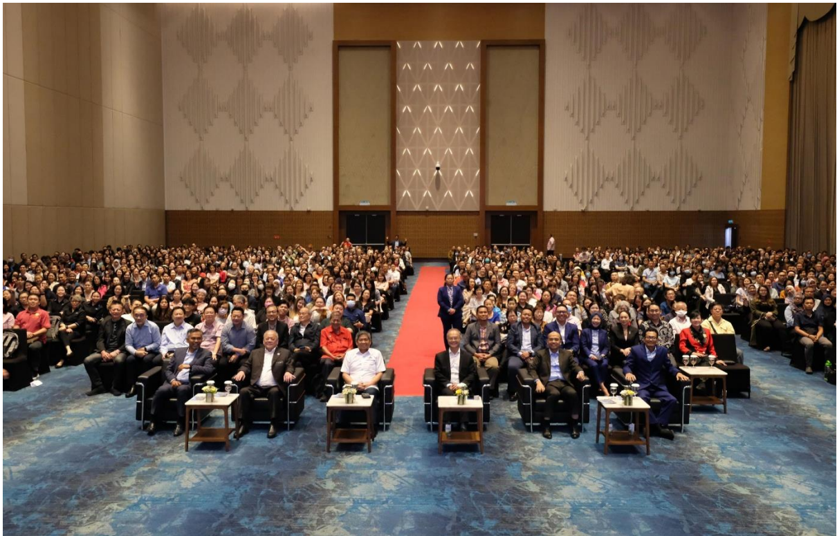
Ketua Pegawai Eksekutif HASiL bergambar kenang-kenangan bersama-sama dengan seramai hampir 1,500 orang peserta Seminar e-Invois.