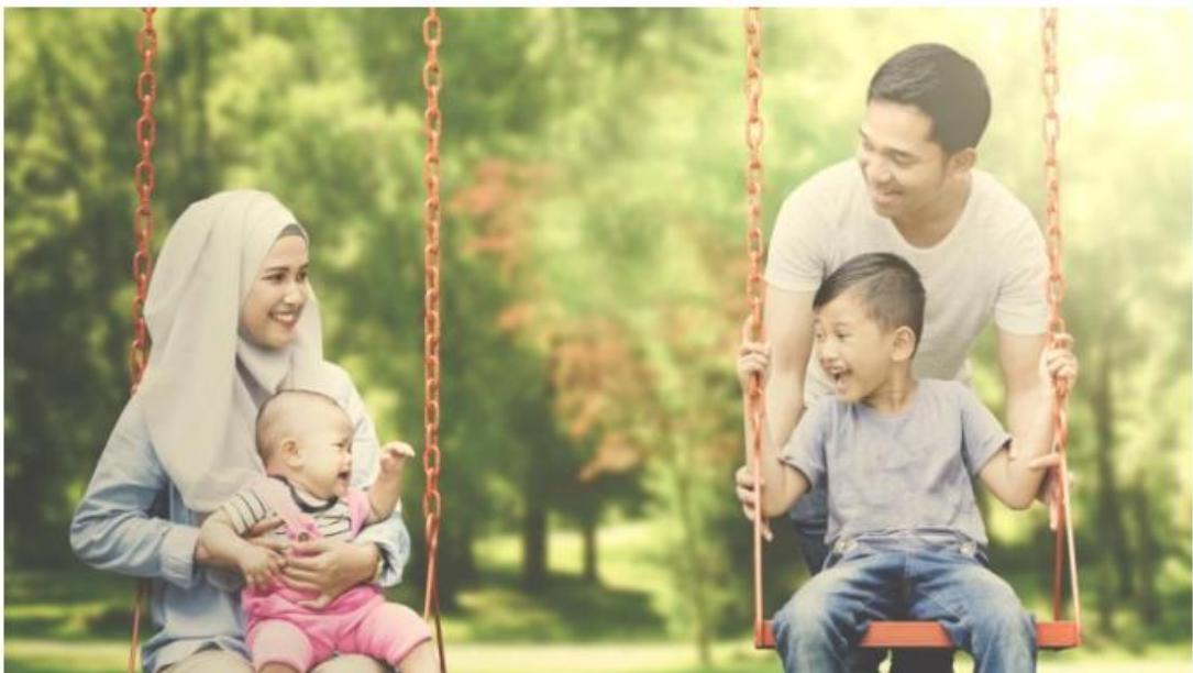
Taman rekreasi dan kemudahan awam yang disediakan hasil cukai menjadikan persekitaran lebih selesa dan teratur untuk dinikmati ahli masyarakat. – Foto Hiasan

Tidak kurang pentingnya ialah aspek kebersihan dan kesejahteraan komuniti.