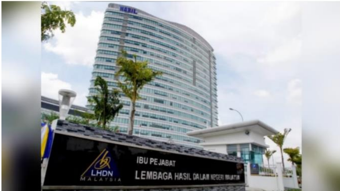
Gambar Ibu Pejabat Lembaga Hasil Dalam Negeri di Cyberjaya. Persediaan & Perancangan Cukai

Akhirnya, persoalan "ke mana perginya cukai kita?" sebenarnya terjawab dalam kehidupan kita sendiri.