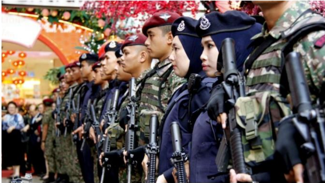
Pasukan polis, tentera dan bomba yang berkhidmat tanpa henti memastikan keamanan dan kestabilan negara turut digerakkan menerusi hasil cukai.

Selain itu, pembangunan infrastruktur negara juga tidak dapat dipisahkan daripada peranan cukai.