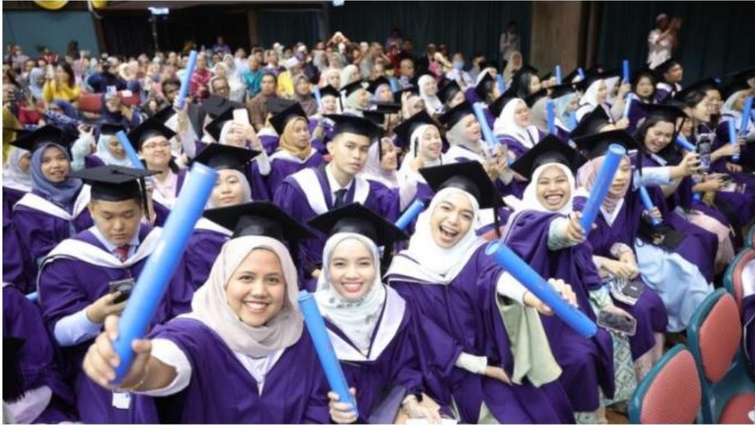
Dalam bidang pendidikan pula, sumbangan cukai membuka pintu masa depan generasi muda. – Foto Hiasan

“Semua ini merupakan manfaat yang dinikmati hasil daripada cukai. Tanpa sumber ini, peluang mendapatkan pendidikan berkualiti secara meluas mungkin tidak dapat dinikmati oleh rakyat Malaysia,” kata HASiL lagi.