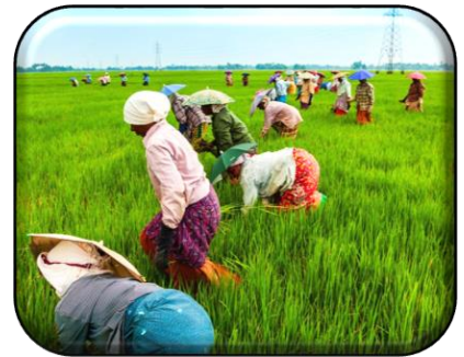
PERTANIAN & INDUSTRI