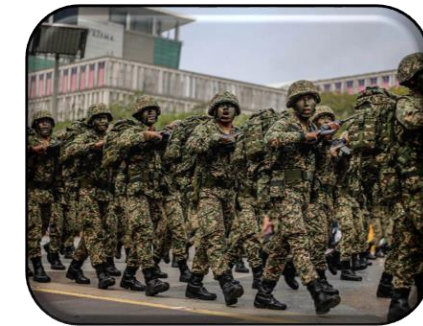
PERTAHANAN & KESELAMATAN NEGARA