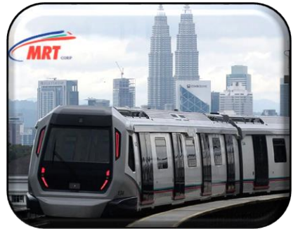
INFRASTRUKTUR & KEMUDAHAN AWAM