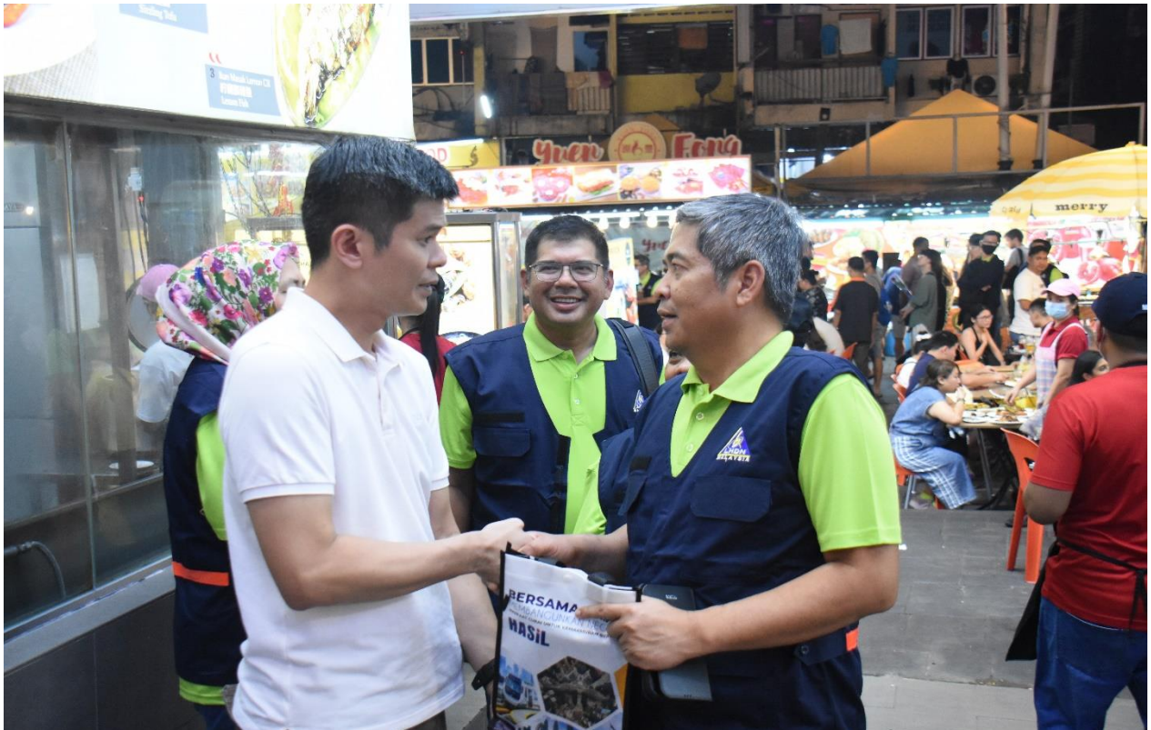
KPE HASiL (depan, satu dari kanan) turun padang menyerahkan bahan-bahan percukaian yang bertujuan untuk meningkatkan tahap kesedaran dan pematuhan cukai dalam kalangan peniaga.