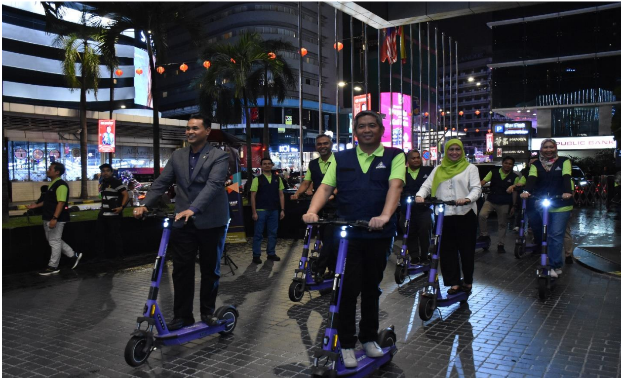
YBhg. Datuk Dr. Abu Tariq bin Jamaluddin, KPE HASiL (depan, satu dari kanan) bersama-sama dengan YBhg. Dato' Azry Akmar bin Dato' Hj Ayob, Timbalan Ketua Polis Kuala Lumpur (depan, satu dari kiri) dan Pengurusan Kanan HASiL memulakan operasi Lawatan Banci Bisnes di Kuala Lumpur.