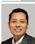
Timbalan Pengarah Eksekutif (Data Strategik), Pejabat Pro Naib Canselor (Strategi dan Pembangunan Korporat), Universiti Kebangsaan Malaysia (UKM)