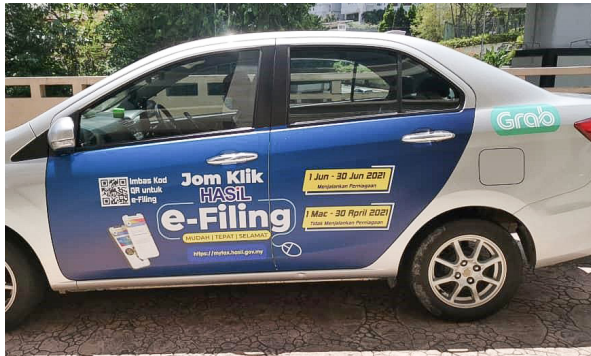
Pendapatan sebagai pemandu Grab juga boleh dikenakan cukai pendapatan sekiranya memenuhi syarat.

Ciri terakhir bagi ekonomi gig ialah bebas menyelesaikan pekerjaan. Hal ini bermaksud, pekerja dapat mengurus tugas tanpa sebarang tekanan. Dengan cara ini, seseorang itu dapat mengurangkan tekanan pada diri dan emosi. Kebebasan bekerja mungkin menjadi ciri utama buat mereka yang memilih menjadi pekerja bebas ( freelancer ) atau bekerja sendiri ( self-employed ).