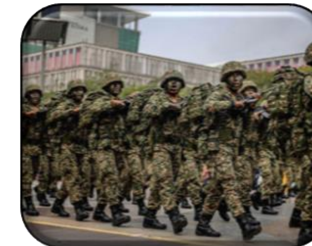
PERTAHANAN & KESELAMATAN NEGARA