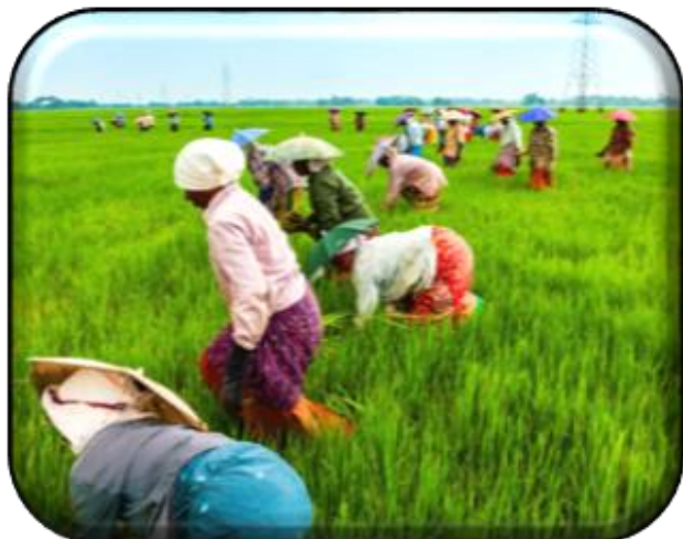
PERTANIAN & INDUSTRI