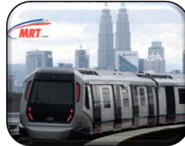
INFRASTRUKTUR & KEMUDAHAN AWAM