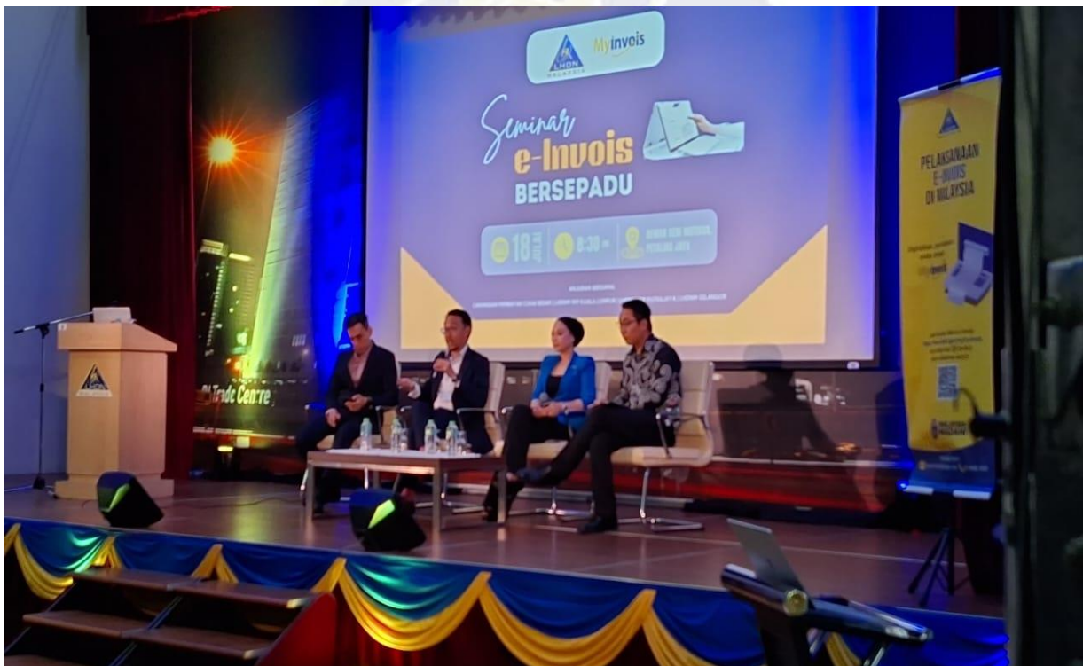
Barisan panel jemputan yang terlibat menjayakan Seminar e-Invois Bersepadu yang berlangsung di Menara HASiL Petaling Jaya.