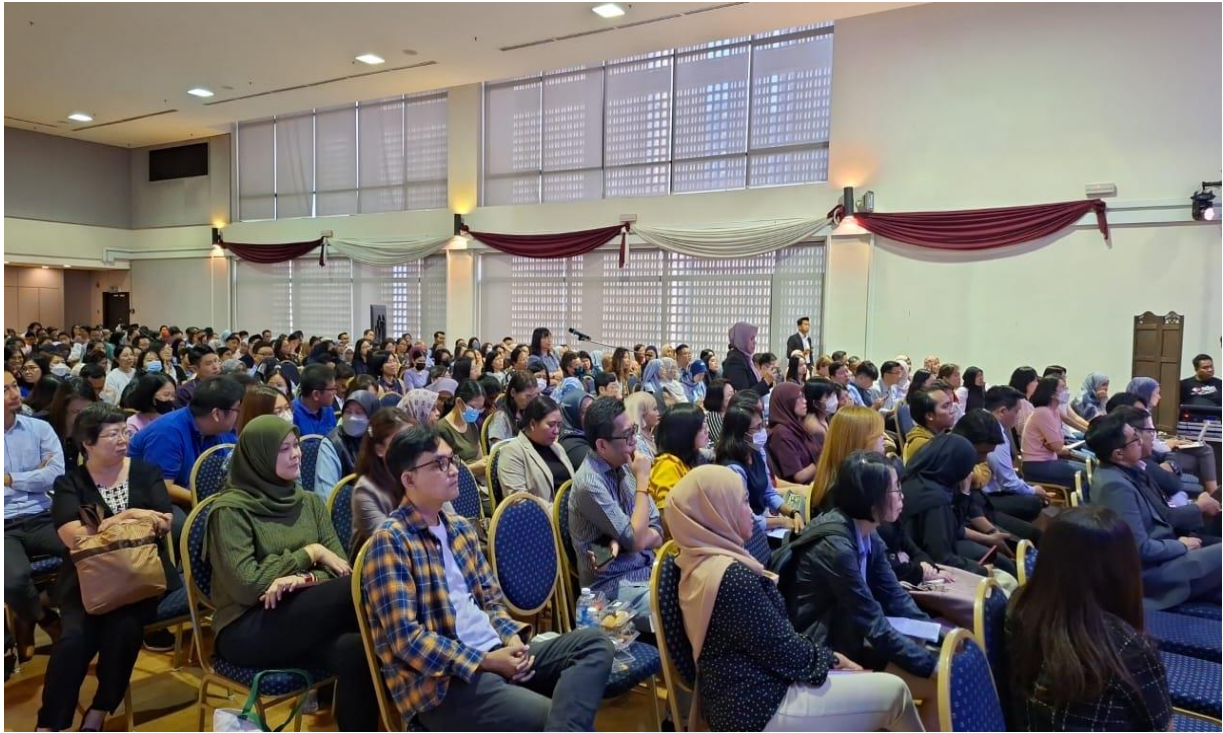
Sebahagian peserta yang hadir memeriahkan seminar tersebut.